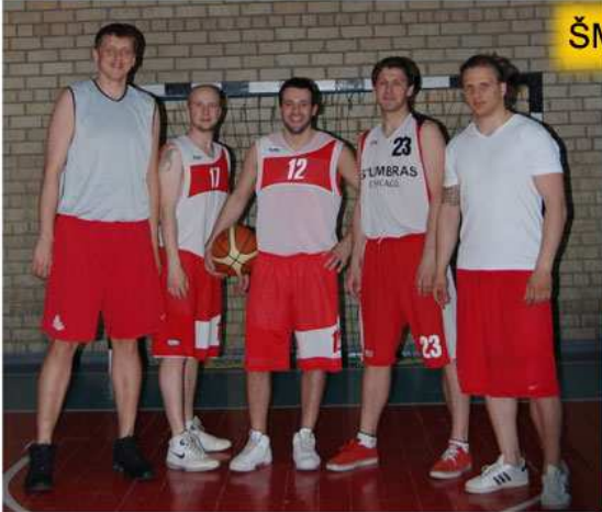
ŠMKA absolventai – gim. 1984 m.